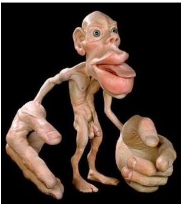
← Die Darstellung der menschlichen Organe proportional zur Anzahl der damit verbundenen Nervenzellen in seinem Gehirn.